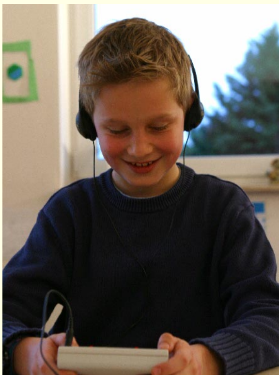
BrainFit Modelle: BrainFit Home, Play und Easy

Diagnostik der Hör- und Sehverarbeitung.